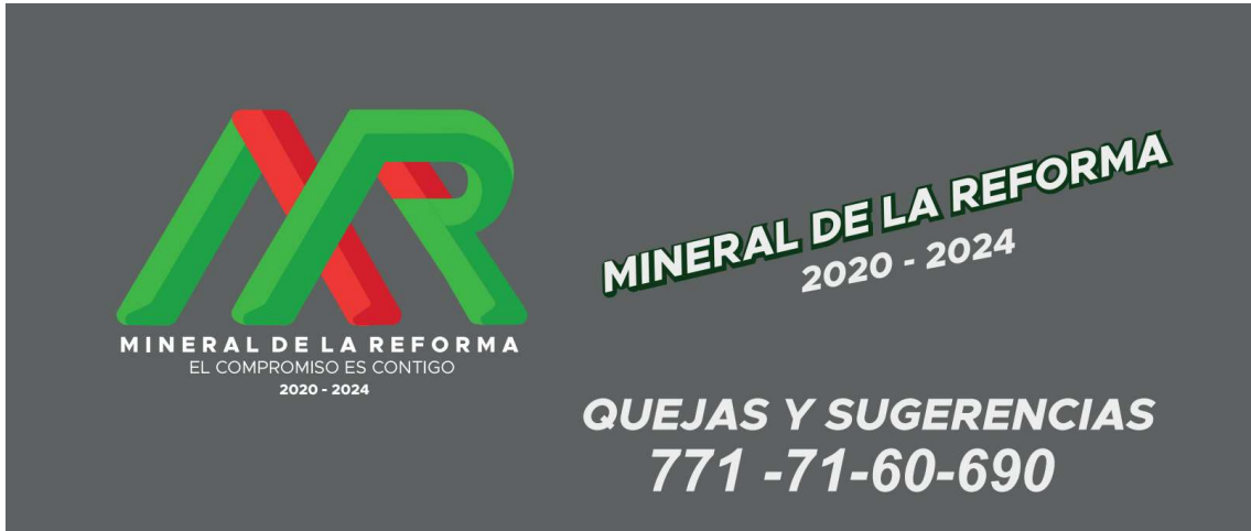
IMAGEN DE LOS LATERALES DE LAS CAMIONETAS