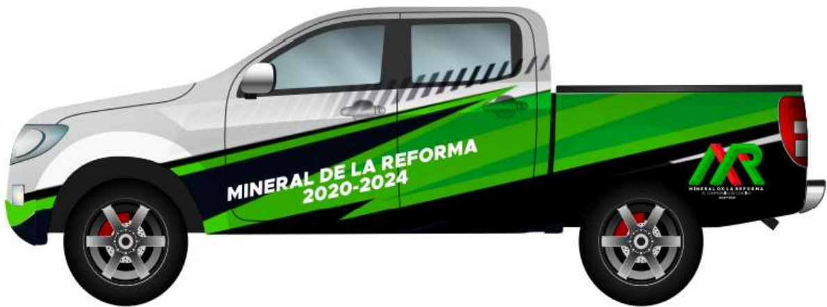
IMAGEN QUE DEBERÁN DE PRESENTAR LAS 4 CAMIONETAS

“ARRENDAMIENTO DE EQUIPO DE TRANSPORTE (CAMIONES Y CAMIONETAS PARA EL SERVICIO DE RECOLECCIÓN DE BASURA)”