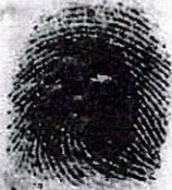
Huella Digital (Finger Print)