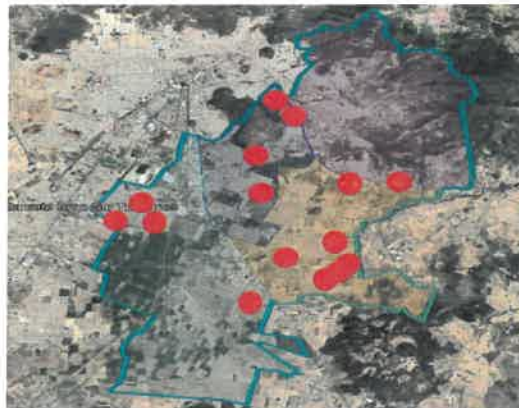
IMAGEN 1 "MAPA DE CALOR DE INCIDENCIA DELICTIVA"